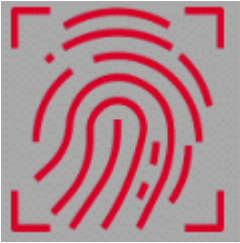
Imagen 12: Error en la lectura de la huella

En caso de que ocurra un error de lectura de la huella (por ejemplo, si la huella no está asociada a ningún usuario registrado), el logotipo de la huella aparecerá en color rojo, como se muestra en la imagen 12.