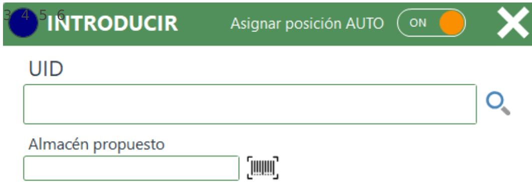
Imagen VI.F.2: Introducción CTShelf/Mini