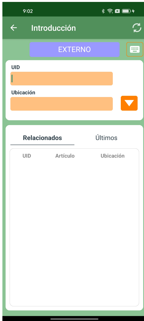
Introducción con aplicación