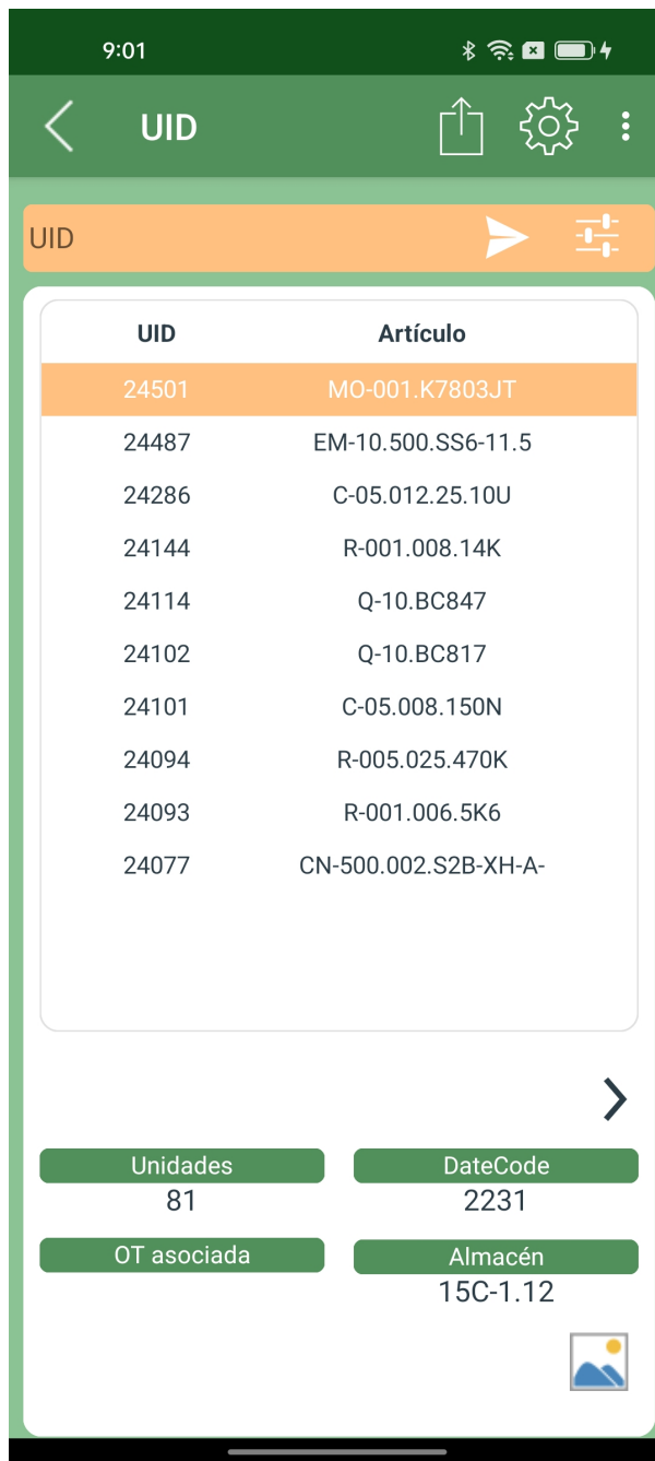
Visualización de UID