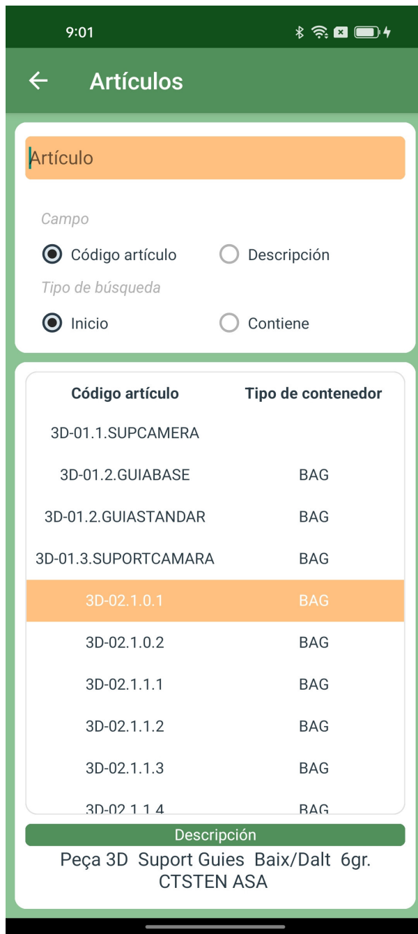
Visualización de artículos