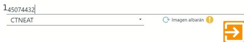
Imagen IX.A.3: Imagen del albarán no actualizada

NOTA: Puedes actualizar la captura con cualquier opción de búsqueda realizada.