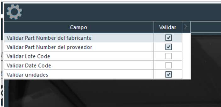
Imagen VIII.A.2: Menú de validación de UID

En este menú de configuración, puedes ajustar los parámetros que el programa debe validar durante el proceso de verificación de UID. Esto te permite personalizar el nivel de validación según tus necesidades y evitar falsos positivos, agilizando el proceso de validación.