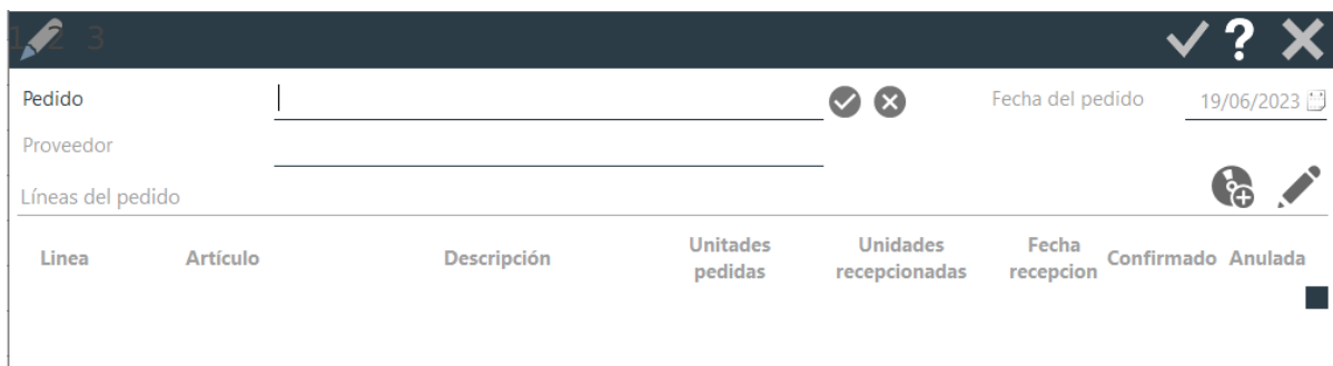
Imagen VI.A.2: Creación de un nuevo pedido

Una vez realizado esto, se abrirá una nueva ventana donde podrás ingresar los detalles del nuevo pedido (imagen VI.A.2).