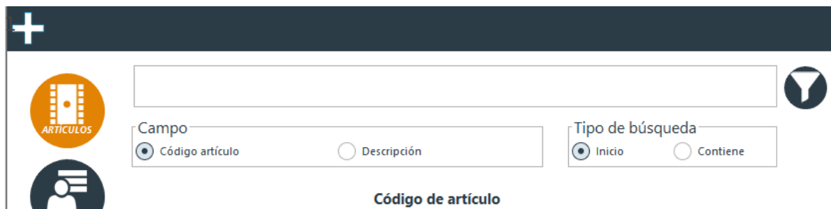
Imagen IV.A.1: Creación de un artículo

Para crear un nuevo artículo en el sistema, simplemente debes pulsar el botón número 1 de la imagen IV.A.1. Esto abrirá una nueva ventana (ver Imagen IV.A.2) en la que se deben especificar los siguientes campos: